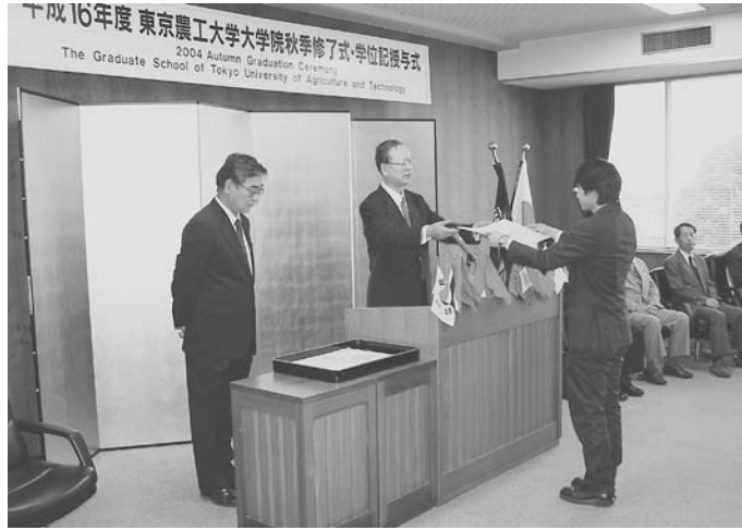
(修了生一人ひとりに学位記を授与)