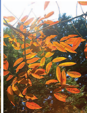
紅葉がきれいなヤマハゼ