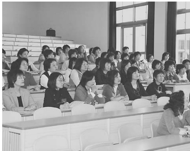
熱心に説明を聞く川越女子高校のPTA

当日は、保護者等91名が出席し、工学教育部の概要、学科説明及び受験生のための入学試験情報等の説明が行われました。また、参加した保護者を対象に本学の「科目等履修生制度」の説明も行われ、熱心な質疑応答が行われました。