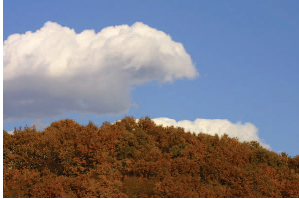
紅葉は青空がよく似合う

F M多摩丘陵の林は、昭和23年に当時の南多摩郡由木村に東京農工大学が土地を購入するまでは、地元の人々の薪炭林として利用されていたと思われます。後になって大学によって植えられたスギやヒノキの林の他は、正にコナラ・クヌギを中心としたいわゆる関東の雑木林の樹木構成となっています。今流行りの言葉で言えば「里山」ということになりましょうか。まだこの言葉は一般的でないのか、わたしのコンピュータのワープロでは「さとやま」と打って変換しても「里山」の漢字は出てきません。