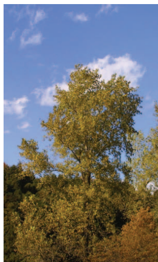
一番背の高いイタリアポプラ