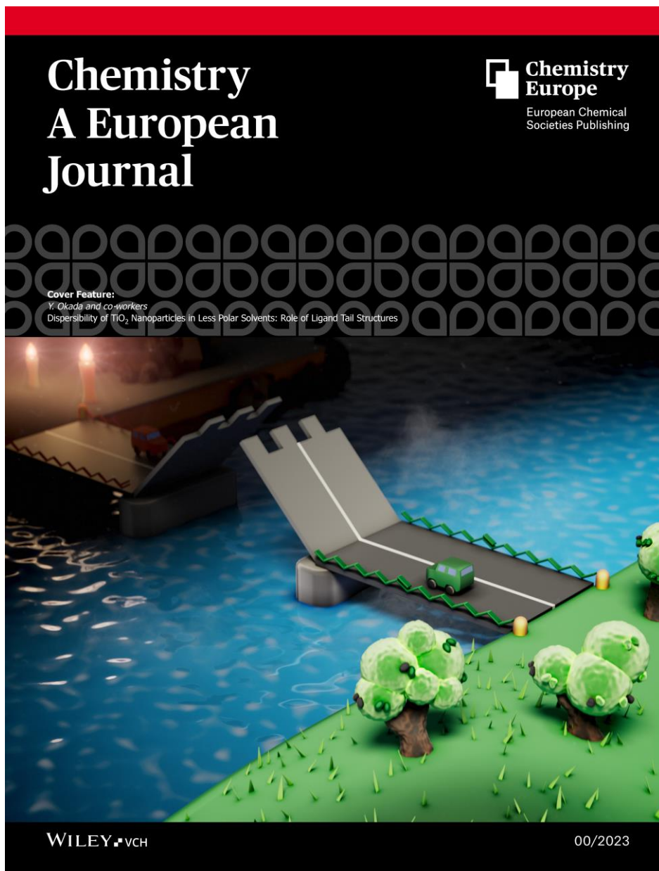
図 3 Chemistry - A European Journal 誌の Cover Picture

今後の展開 ：本研究の成果は、低極性溶媒中におけるナノ粒子の分散凝集理論の体系化に有用な知見であり、ナノ粒子応用の発展に貢献できるものです。