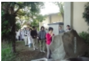
慰霊碑に献花する学生