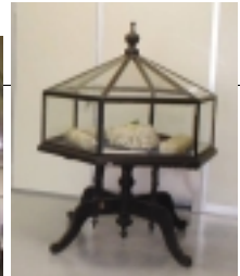
左の写真は、附属繊維博物館所蔵のジャカード織機。上は、生糸の展示。