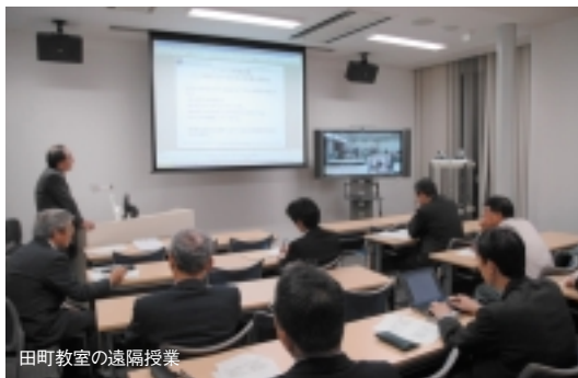
田町教室の遠隔授業

学内インキュベーションなど豊富な産学連携実績をバックに、技術社会が要請する問題解決能力を確実に付与できる教育が特徴。小さいクラス編成で演習が多く、仕事を終えて駆けつける社会人のデスクセッションに触発され、教師も一般学生も真剣そのもの。苦労は多いですがMOT教師冥利を満喫しています。ナンバーワンのMOTを目指します。