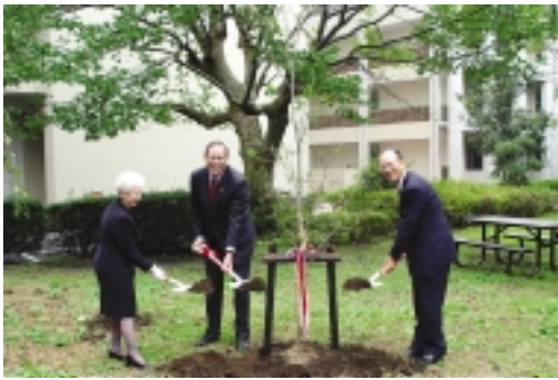
ハナミズキの記念植樹で日米親善