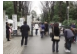
農学部試験場の開門風景