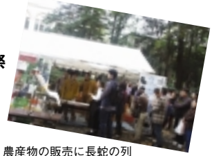
農産物の販売に長蛇の列