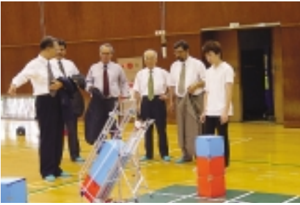
ロボット研究会が「NHK 大学ロボコン2004」でアイデア賞を受賞、ロボット実演を見学する大臣一行