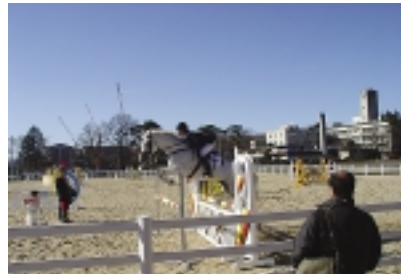
馬術部員によるデモンストレーション