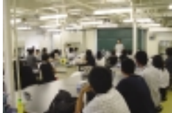
学科実験室での説明